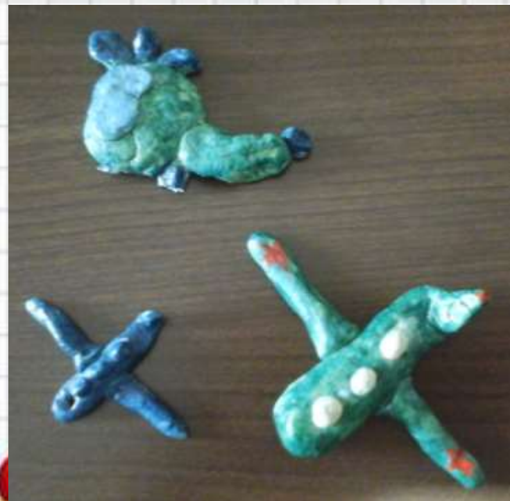
Кулоны для мам на 8 марта